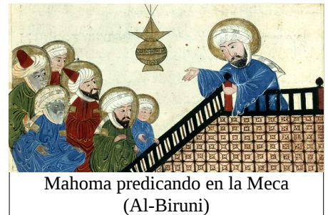
Mahoma predicando en la Meca (Al-Biruni)

El Corán no prohíbe la representación de Mahoma . Sin embargo, los sunnites tienden a rechazar cualquier representación humana y, sobre todo, la de cualquier profeta; se basan en los hadices que lo prohíben. Los chiíes son más abiertos y realizan habitualmente representaciones respetuosas de Mahoma. Además, hay imágenes e ilustraciones históricas muy conocidas provenientes de autores muy bien considerados en la cultura islámica como Al-Biruni, sabio persa que vivió en el siglo XII.